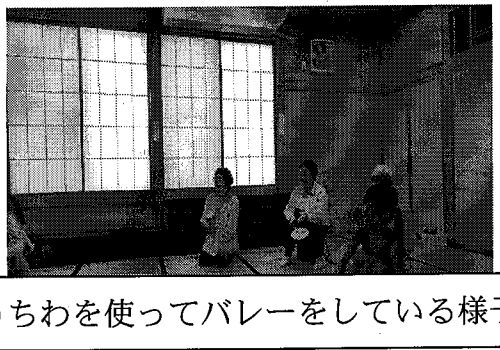
うちわを使ってバレーをしている様子