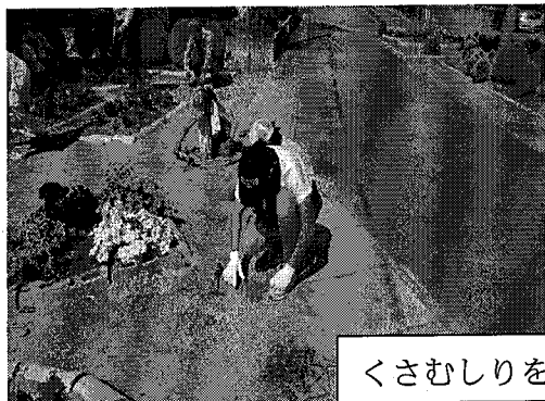
くさむしりをしている様子

8月の活動は、6月に花植えをしたところの草むしりでした。気温も上がり、暑いなかでしたが一生懸命に草をむしってくださいました。みなさんの植えた花は、暑さにも負けず元気に咲いていました。その後、一緒に草むしりをした郡山花咲かせ隊の方々とうちわを使い座ったままのバレーをして楽しみました。