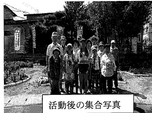
活動後の集合写真