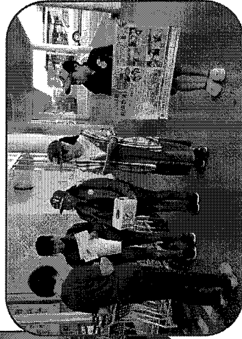
赤い羽根共同募金街頭募金活動をします。赤い羽根共同募金で集 まった南陽市の募金は、南陽市の福祉のために使われています。 ぴよっこの活動資金も赤い羽根共同募金からいただいています。