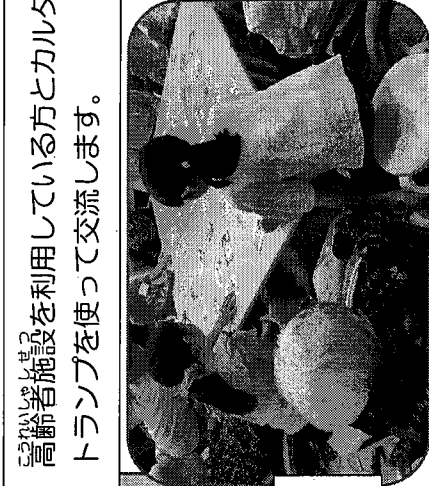
高齢者施設を利用していらっしゃる方とカルタや トランプを使って交流します。