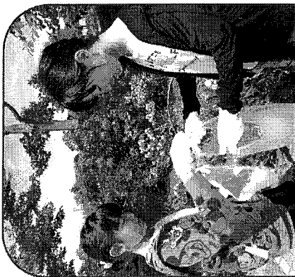
はじめの会のあと、防災センター 周辺のゴミ拾いをします。