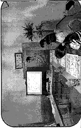
認知症とは、どんな病気なのかを みんなで勉強します。